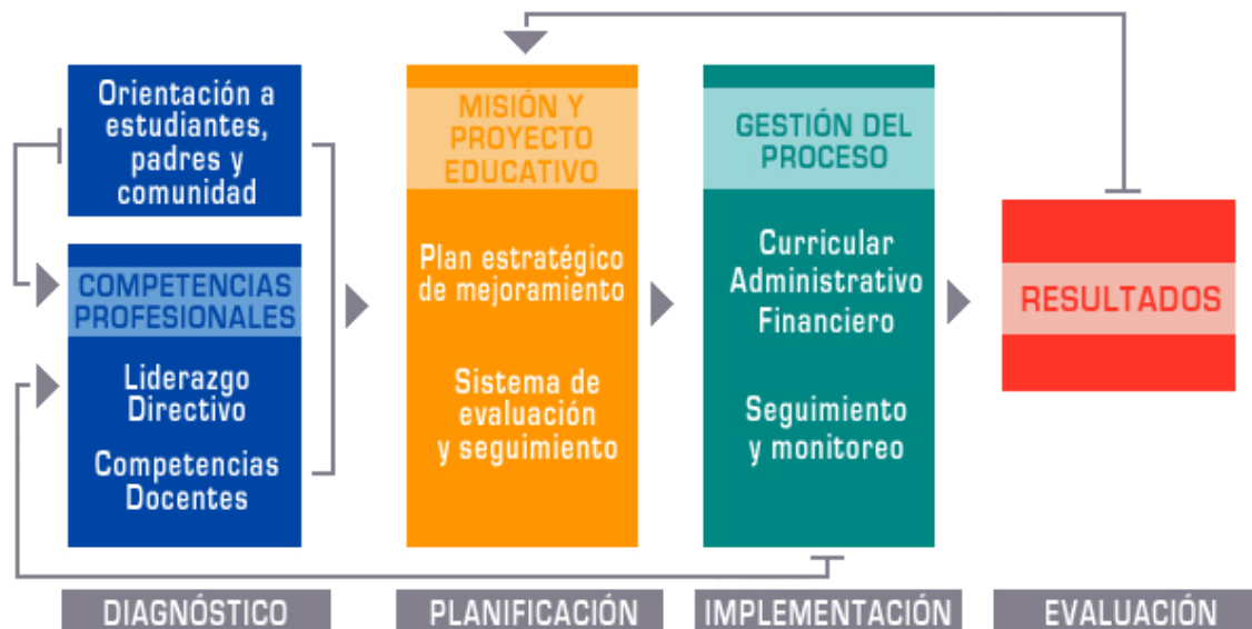
Figura 2: Modelo de Gestión de Calidad de la Fundación Chile