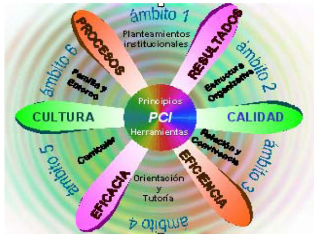
Figura 3: Proyecto de Calidad Integrado